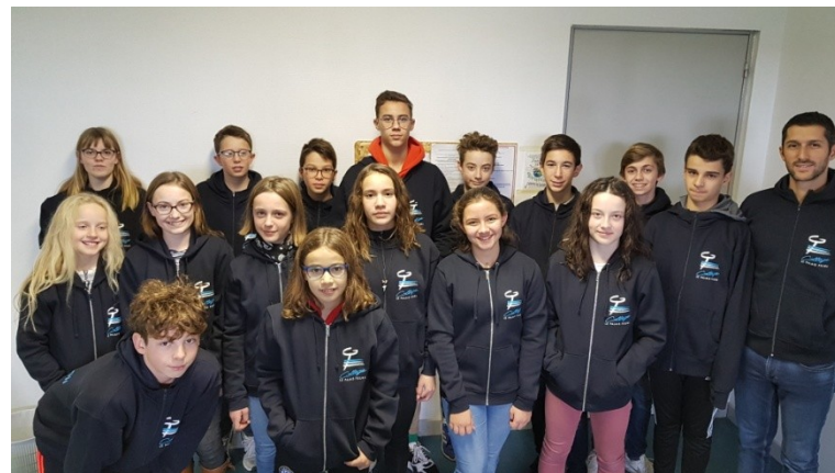
La section sportive 2019-2020

Pour de plus amples renseignements vous pouvez visiter le stand des sections sportives Salle 200 lors de la journée portes ouvertes ou bien contacter le secrétariat de direction ou la principale adjointe.