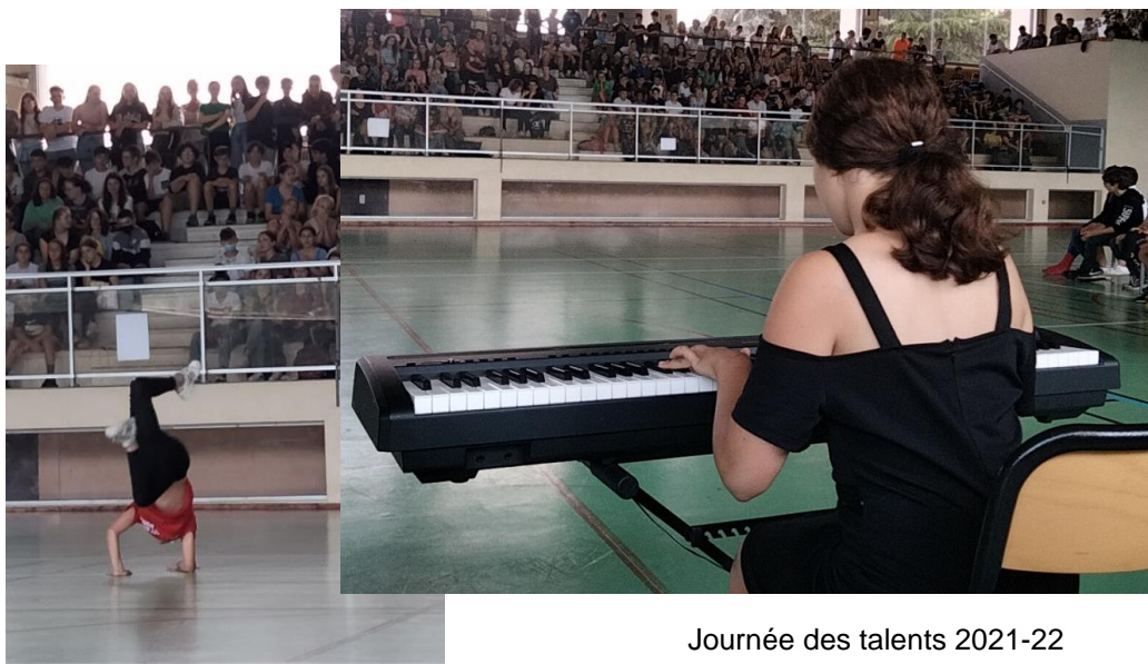
Journée des talents 2021-22

En 2021-22, il a organisé la journée des talents, la semaine des langues, la journée de l'élégance. Il a également participé à des collectes solidaires.